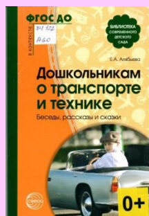
Алябьева Е.А. Дошкольникам о транспорте и технике : беседы, рассказы и сказки

Там, где шумный перекресток, Где машин не сосчитать, Перейти не так уж просто, Если правила не знать. Пусть запомнят твердо дети: Верно поступает тот, Кто лишь при зеленом свете Через улицу идет! (Н. Сорокин)