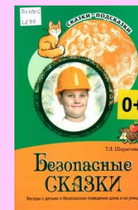
Шорыгина Т. А. Безопасные сказки : беседы с детьми о безопасном поведении дома и на улице

безопасности. Занятия, построенные в форме бесед, сопровождаются стихами, сказками, загадками, вопросами и тестами... Пособие предназначено для старших дошкольников и может быть использовано при коллективной и индивидуальной форме обучения.