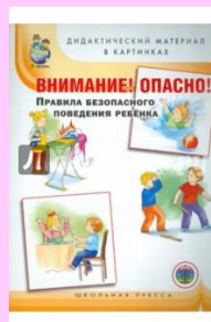
Внимание! Опасно! Правила безопасного поведения ребенка. Дидактический материал в картинках

Аннотация: В книге представлены авторские беседы, рассказы и сказки для детей 5—8 лет обо всех видах транспорта... Познавательные рассказы и сказки имеют методическую составляющую. Книга предназначена для воспитателей дошкольных учреждений, гувернеров, родителей и детей.